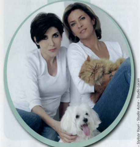
Styliste Yauri - Studio Astre - Studio Locant

FRANCE : L'ÉTIQUETAGE DE LA FOURRURE EN QUESTION EUROPE : NON A LA FOURRURE DE CHAT ET DE CHIEN !